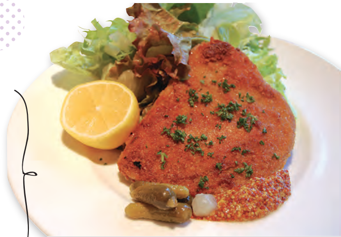
タブリエ・ド・サブ 2,100円

☎044-946-5727 / 菅2-2-26タウンハイツ稲田堤1F / 17:00~23:30(土日祝16:00~23:30) / 休無