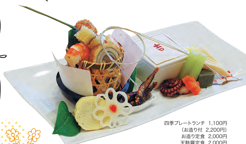
四季プレートランチ 1,100円 (お造り付 2,200円) お造り定食 2,000円 天麩羅定食 2,000円 鰻定食 2,700円

☎044-911-3191 / 登戸2466 / 10:00~21:00(ランチは11:30~13:30) / 休月曜