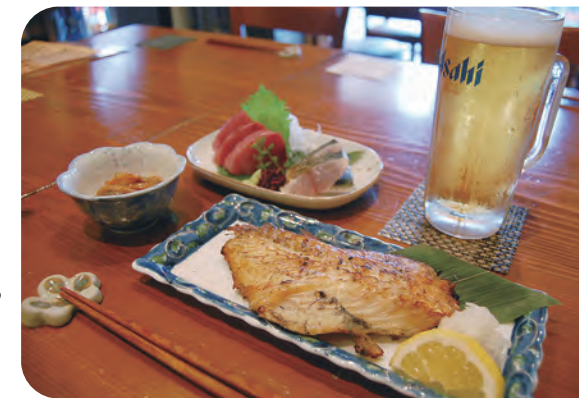
大人気のとりあえずビールセット1000円+アコウダイの干物500円