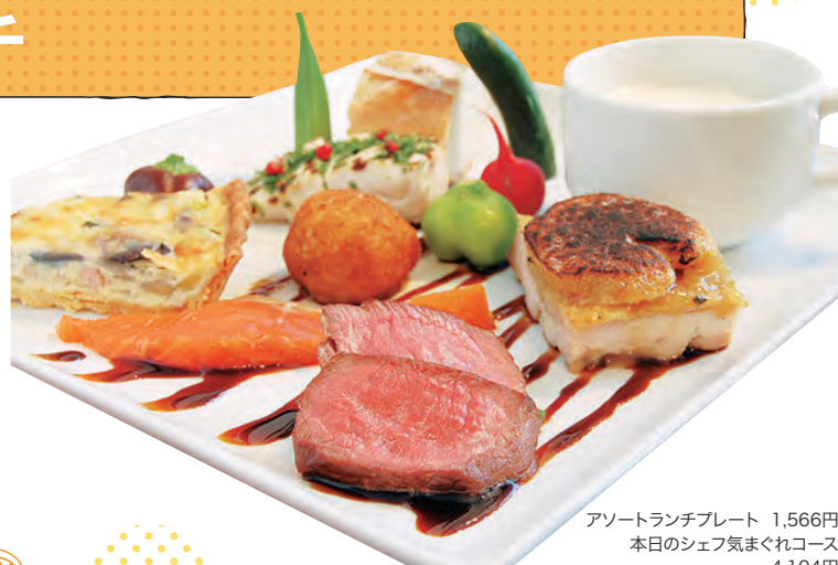
アソートランチプレート 1,566円 本日のシェフ気まぐれコース 4,104円

☎044-933-6621 / 登戸3415 / 11:00~14:00(土日祝~15:00)、17:30~23:00(日祝~21:00) / 休水曜