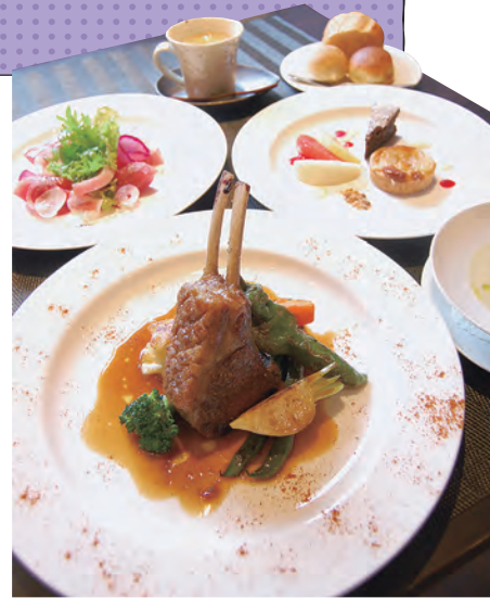
メインが選べるディナーコース 3800円 子羊のロースト スパイス風 2200円

☎044-299-6878 / 生田7-19-9センダビル2階 / 11:30~13:30, 17:30~20:30 / 火曜・月1回水曜休み