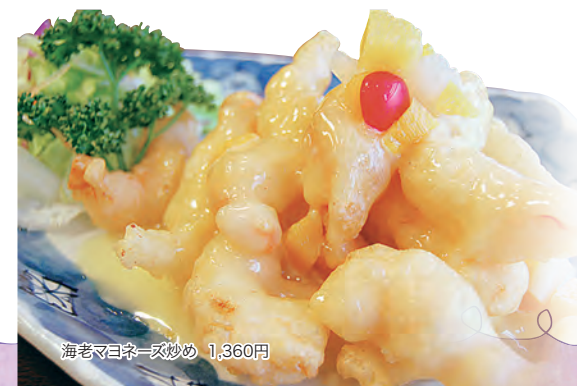
海老マヨネーズ炒め 1,360円

☎044-922-2106 / 登戸新町421登戸21ビル1階 / 11:30~14:30, 17:00~23:00(土日祝11:30~15:00, 16:30~23:00)