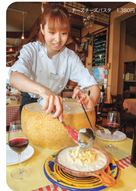
チーズチーズパスタ 1,380円