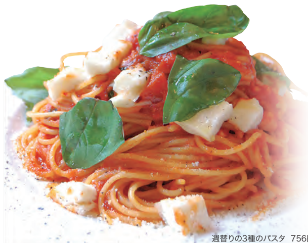
過替りの3種のパスタ 756円

☎044-953-5436 / 西生田1-20-1 / 11:00~21:00 / 休月曜・第1火曜