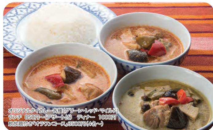
オリジナルタイカレー各種(グリーン・レッド・マレッド) ランチ 850円~(デザート付) デイナー 1000円 敵放題付きオラワンコース 3500円(4名~)

☎044-934-6272 / 登戸1728 / 11:30~14:00(土日祝~15:00)、18:00~23:00 / 休月曜(祝日の場合は営業)