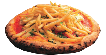
マルゲリータ・コンパティエーネ 1,490円

名物はお客様の前でチーズを絡めて仕上げるチーズチーズパスタ。他にも350℃の高温石釜で焼き上げた本格ピッツァも楽しめる。不定期でアコーディオンやフルートの生演奏も開催。家族で陽気なディナーをお楽しみあれ。