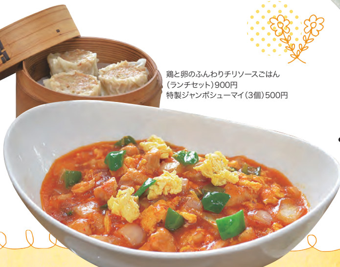
鶏と卵のふんわりチリソースごはん (ランチセット)900円 特製ジャンボシューマイ(3個)500円