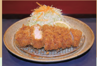
ローズかつ定食(松) 1,944円

とんかつたけしん 多摩区で唯一「ミシュランガイド横浜・川崎・湘南2015」に掲載・推薦された名店。食材に徹底的にこだわり、サクサクの食感を楽しめる。幅広い年齢層から人気を集めており、ちょっと特別な日や、おもてなしをしたい日に最適だ。 ☎044-976-0477 ☎南生田4-12-5 ☎水曜 ☎11:00~22:00