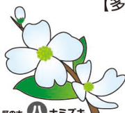
区の木 ハナミズキ